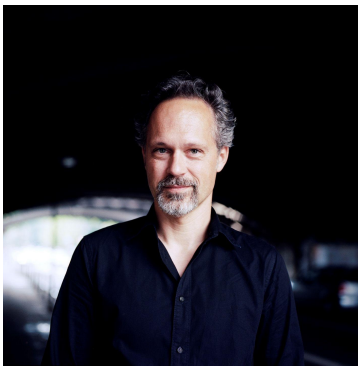
Marc Raabe

Vertretung des Landes Nordrhein-Westfalen beim Bund, Hiroshimastraße 12-16, 10785 Berlin